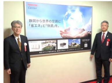
▲「TC Room24」と命名されました