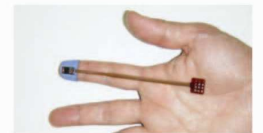
超薄型指先一体型 (胎児、手術用)