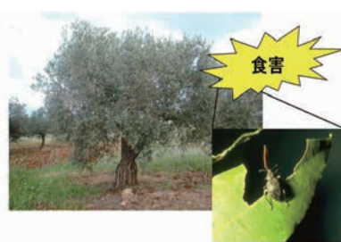
植物の防御機構の仕組みは？

植物は数万種の天然化合物を合成 (生産) しており、我々人間は長い歴史の中で多くの有用成分を発見してきました。しかし、それら有用天然化合物が植物自身にとってどのような意味を持っているかはまだ謎のままです。植物自身の身を守る化合物に注目して、その生合成や分布を化学的実験手法や生化学的実験手法を用いて研究しています。このことは環境ストレスに強い植物の育成に役立つだけでなく、有用天然化合物を植物から抽出せず人工的に生産するためのファーストステップになります。植物生理活性物質やその生合成に関与する酵素・遺伝子について有機化学、天然物化学、生化学、分子生物学などの多様なアプローチで追究することで、植物生理活性物質が司る生命現象を追究することを目的としています。