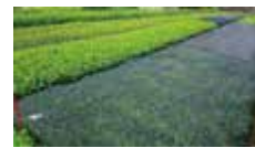
持続的に高品質な茶葉を生産する上ではバランスが大切

茶樹に遮光ネットなどを被せて光合成に必要な光の受容を阻害することは、抹茶加工品の着色に有効とされているクロロフィルaや、甘みの成分であるテアニンの含有量を高める上で有効です。このように農作物の高付加価値化のために、植物にとっては必ずしも好ましくない条件下で農業が実施されることが少なくありません。当然ながら、このようなストレスを植物に加えることは収量の低下、時には枯死を引き起こすことがあります。よって、バランスを考えたストレスの強度やタイミングといった微妙な制御が必要とされています。しかし、農作物の品質やストレスを正確に評価するためには農産物を破壊した後、薬品や高価な計測機械を使用して成分を分析する必要があり、生育している状態で植物の応答を追跡・管理することは容易なことではありません。一方、植物は成分やストレスを受けると光の反射パターンに変化が生じます。そこで、このパターンの変化を用いることによって、ストレスと品質の定期的な評価を実施し、最適な農業を実現する上で有効な情報を提供していきたいと考えております。